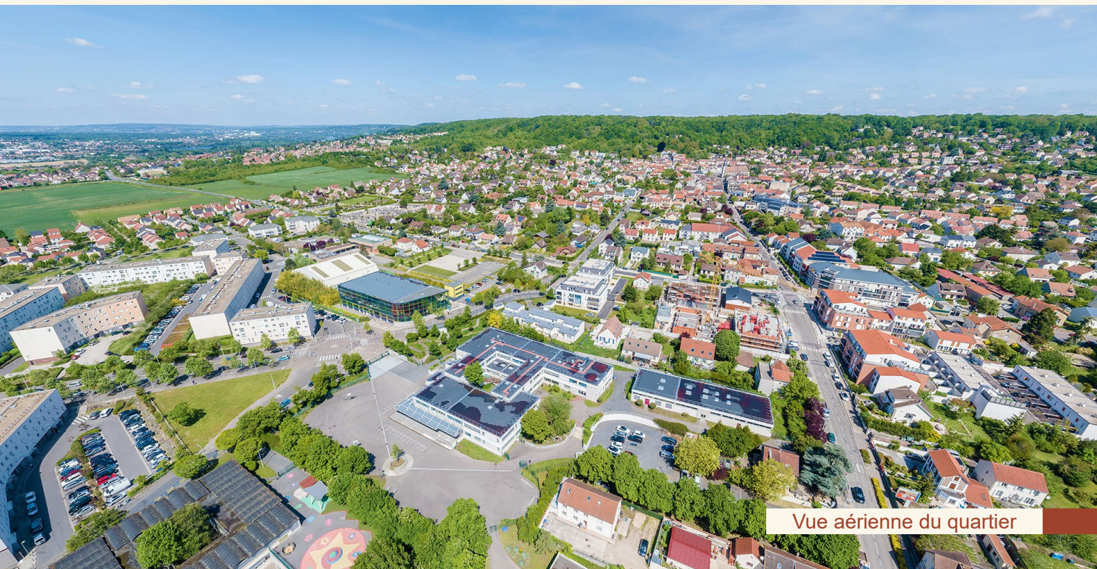
Vue aérienne du quartier